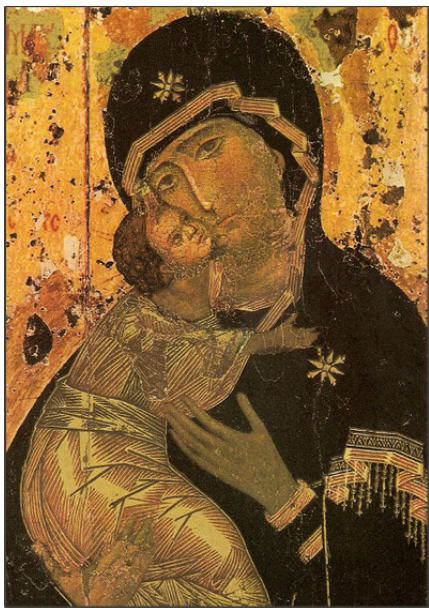
Guds Moder af Vladimir

Et af de kendteste ikoner, Guds Moder af Vladimir fra ca. 1130, er Ruslands nationalhelligdom, og har gennem århundreder været Ruslands værn mod ydre fjender. Ikonen hænger i dag i Tretjakov-Galleriet i Moskva. Desværre er ikonen meget medtaget af alder og i fremskredent forfald.